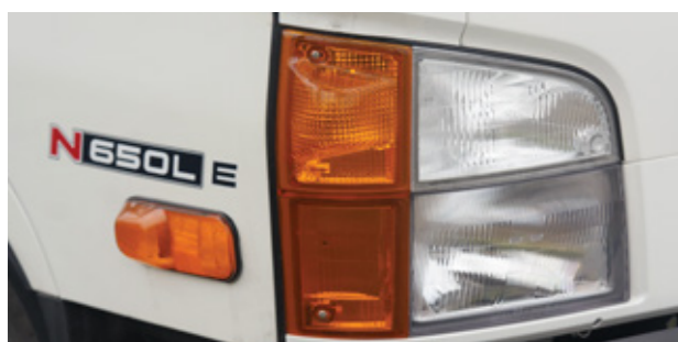
Đèn pha với chóa phản quang

Mighty N650L sở hữu ngoại thất được trau chuốt với những đường nét tinh tế, mang lại vẻ ngoài mạnh mẽ. Điểm nhấn nổi bật là gương chiếu hậu tầm nhìn rộng, đảm bảo an toàn tối ưu khi vận hành. Đèn pha cỡ lớn được thiết kế sắc nét, không chỉ nâng cao tính thẩm mỹ mà còn cung cấp khả năng chiếu sáng vượt trội trong mọi điều kiện.