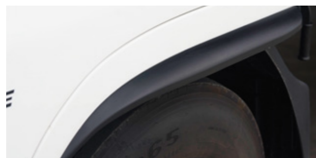
Vè chắn bùn mở rộng