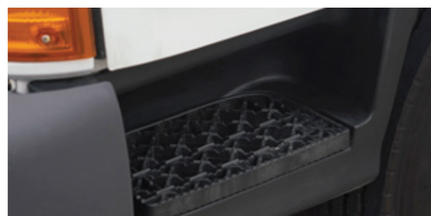
Bạc lên xuống được thiết kế tiện lợi