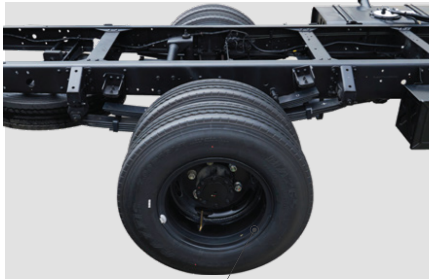
Lốp xe 7.00R16 đồng kích thước trên cả hai trục

Mighty N650L được trang bị động cơ D4CC mạnh mẽ, đạt công suất tối đa 117.6 kW tại 3000 vòng/phút và mô-men xoắn cực đại 392.4 N.m tại 1400-2800 vòng/phút, dẫn đầu phân khúc về hiệu suất. Hệ thống khung gầm và hệ thống treo đạt tiêu chuẩn Hàn Quốc, kết hợp lốp xe 7.00R16 đồng kích thước trên cả hai trục, đảm bảo khả năng vượt chướng ngại vật xuất sắc và vận hành ổn định trên mọi địa hình.