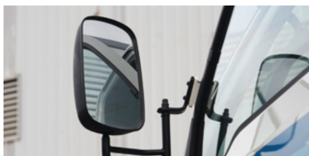
Gương chiếu hậu với tầm nhìn rộng