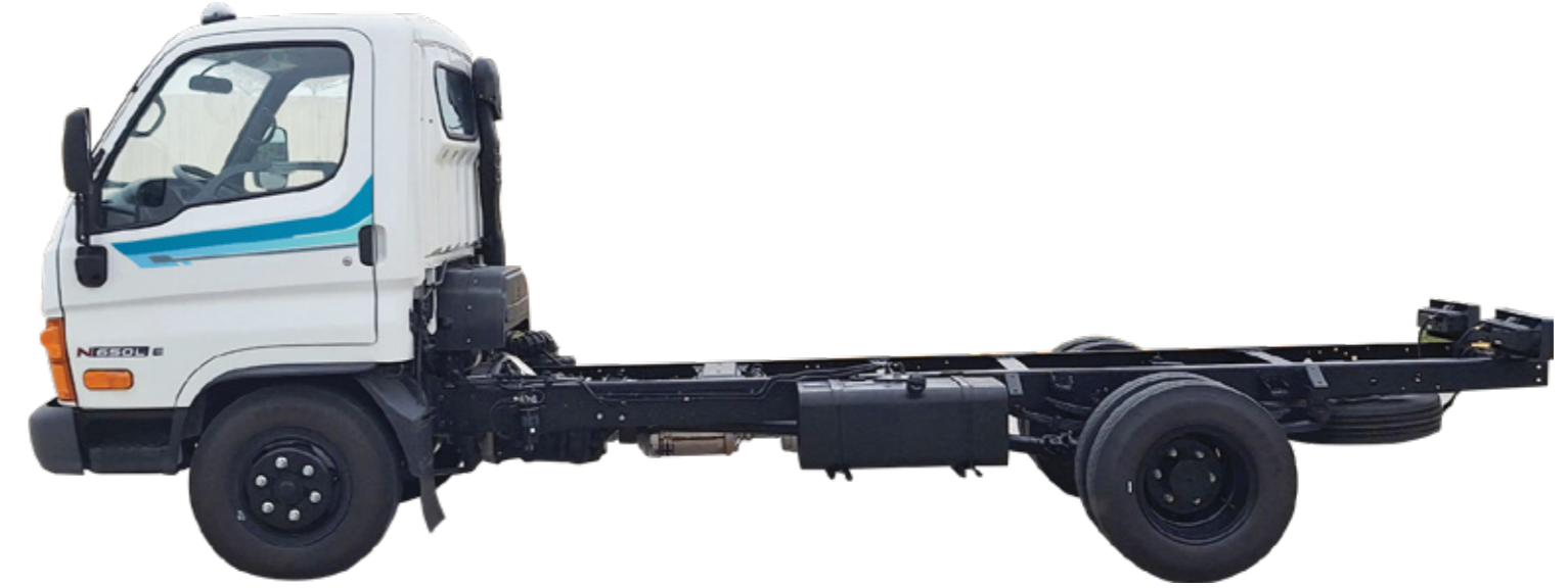
Diesel, 4 kỳ, 4 xi lanh thẳng hàng, tăng áp, làm mát bằng chất lỏng